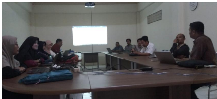
Gambar 2. Koordinasi persiapan penyelenggaraan bedah buku

Pembentukan panitia dalam rangka mempersiapkan pelaksanaan bedah buku, persiapan terkait konfirmasi pembedah dan penulis serta moderator, juga pengisi acara. Juga terkait dengan teknis lapangan.