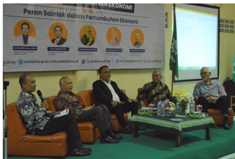
Gambar 3. Narasumber, pembedah, penulis dan moderator