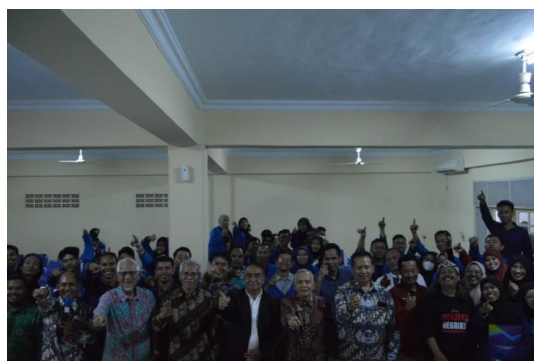
Gambar 6. Swafoto seluruh pengisi acara dengan peserta

Sesi ini diawali dengan penyampaian materi peran teknologi informasi komputer dalam pertumbuhan ekonomi kemudian dilanjutkan dengan sesi diskusi dan tanya jawab. Menjelang akhir acara panitia memberikan hadiah buku kepada tiga orang penanya dan dua buah tumbler SaintekMu kepada peserta acara yang datang lebih awal. Kegiatan ini juga sudah dapat memicu semangat dan antusiasme peserta, hal ini terlihat dari animo peserta dalam sesi diskusi dan tanya jawab.